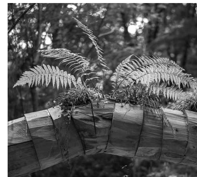
Rumen Dmitrov, Jardines colgantes - Metamorphosis / Hanging Gardens - Metamorphoses (2014). Plantas y madera / plants and wood.