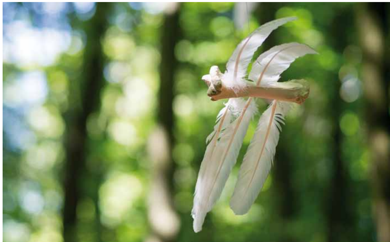
Kathe Wenzel, Knackenvogel (2014). Huesos y plumas / bones and feathers.