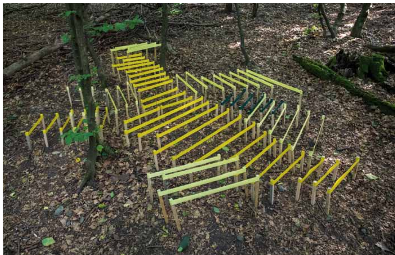
Waltraud Munz, Colonias de primavera - mapa coreográfico / Spring Colonies - A Choreographic Map (2014). Tela coloreada / colored fabric.