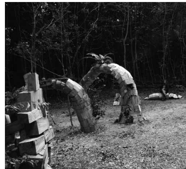
Rumen Dmitrov, Jardines colgantes - Metamorphosis / Hanging Gardens - Metamorphoses (2014). Plantas y madera / plants and wood.